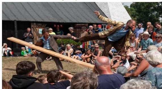
Don Gnu. To mand og en planke

Men trods alle disse opgivet projektet om det i pressen. Vi måske også fristende hjemmeside samt på facebook.